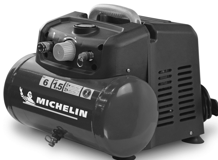
Model: MBL 6V2/1100